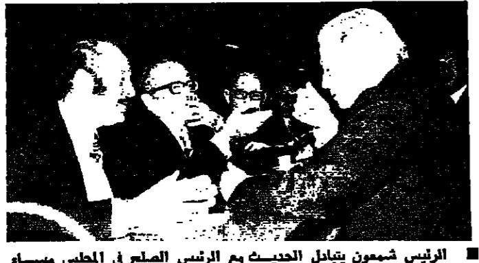
الرئيس شمعون بيبال الحديث مع الرئيس الصلح في المجلس مساء أمس